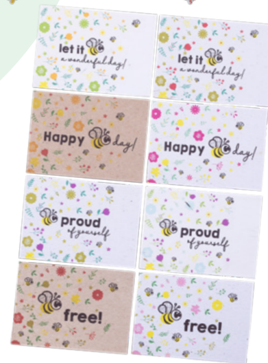
Plantbare ansichtkaarten bijen Set van 8 | Formaat: 14,8 x 10,5 cm € 12,50 C2.3.840