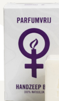
Handzeep bar - parfumvrij € 4,99 C2.2.351