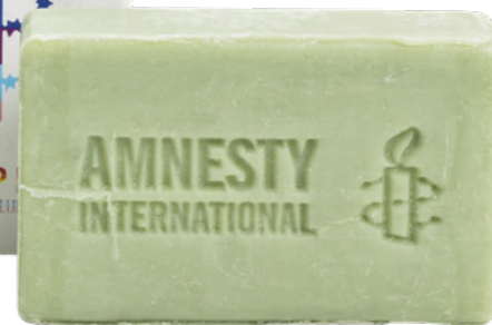
Handzeep bar - pure cotton € 4,99 C2.2.354

Plasticvrij en zacht voor de huid. Eén bar = 2-3 flessen zeep. Vegan, dierproefvrij, goed voor de planeet én in Nederland geproduceerd! 7 x 4.3 x 2.8 cm