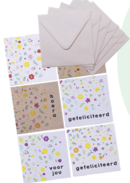
Plantbare wenskaarten bijen Set van 6 | Formaat: 12 x 12 cm (incl. envelop) € 12,50 C2.3.838