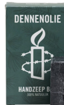
Handzeep bar - dennenuolie € 4,99 C2.2.352