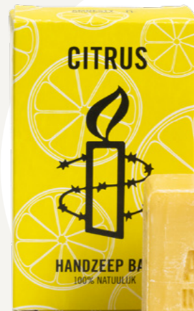
Handzeep bar - citrus € 4,99 C2.2.353