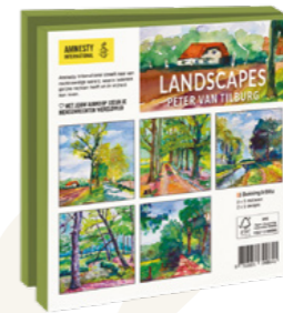
Peter van Tilburg Landscapes 10 kaarten. 14,5 x 14,5 cm, 2 x 5 ontwerpen met enveloppen € 9,99 C2.3.826