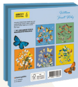
William Forsell Kirby Graceful 10 kaarten. 14,5 x 14,5 cm, 2 x 5 ontwerpen met enveloppen € 9,99 C2.3.831