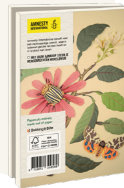
Geertje Aalders Flowers and Insects 10 kaarten. 10,3 x 15,4 cm, 5 x 2 ontwerpen met enveloppen € 8,99 C2.3.837