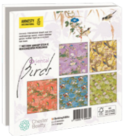
Chester Beatty Oriental Birds 10 kaarten. 14,5 x 14,5 cm, 2 x 5 ontwerpen met enveloppen € 9,99 C2.3.828