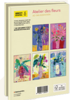
Ad van Bokhoven Atelier des Fleurs 10 kaarten. 13,5 x 18,5 cm, 2 x 5 ontwerpen met enveloppen € 9,99 C2.3.832