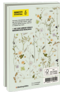
Janny van den Broek Sweet Summer 10 kaarten. 10,3 x 15,4 cm, 5 x 2 ontwerpen met enveloppen € 8,99 C2.3.834