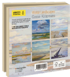
Gosse Koopmans Water Landscapes 10 kaarten. 14,5 x 14,5 cm, 2 x 5 ontwerpen met enveloppen € 9,99 C2.3.829