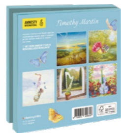
Timothy Martin Floral Instruments 10 kaarten. 14,5 x 14,5 cm, 2 x 5 ontwerpen met enveloppen € 9,99 C2.3.825