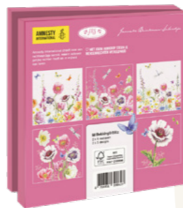
Janneke Brinkman Wild Flower Field 10 kaarten. 14,5 x 14,5 cm, 2 x 5 ontwerpen met enveloppen € 9,99 C2.3.824