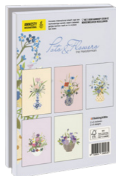
Ine Heesterman Pots and Flowers 10 kaarten. 13,5 x 18,5 cm 2 x 5 ontwerpen met enveloppen € 9,99 C2.3.833