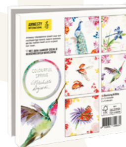
Michelle Dujardin Colourful Spring 10 kaarten. 14,5 x 14,5 cm, 2 x 5 ontwerpen met enveloppen € 9,99 C2.3.827