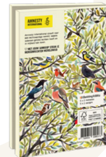
Miriam Bos Vogels in de tuin 10 kaarten. 10,3 x 15,4 cm 5 x 2 ontwerpen met enveloppen € 8,99 C2.3.836