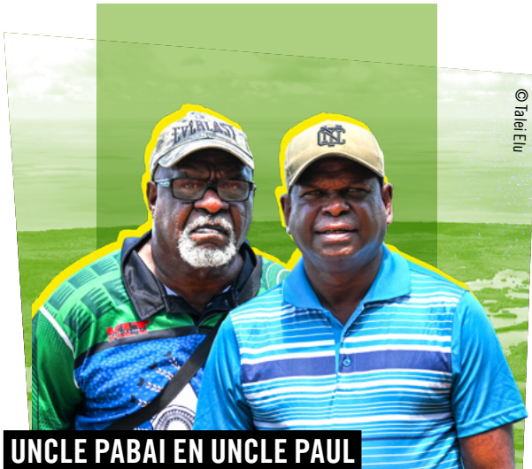
UNCLE PABAI EN UNCLE PAUL AUSTRALIË

In elk verhaal zijn er meerdere mensenrechten die gebruikt of geschonden worden. Laat de leerlingen zelf de Universele Verklaring van de Rechten van de Mens (UVRM) bestuderen en de artikelen opzoeken die bij de verhalen horen. Daag ze ook uit om te vertellen waarom dat zo is. De verkorte versie van de UVRM is te vinden op de bijgeleverde poster.