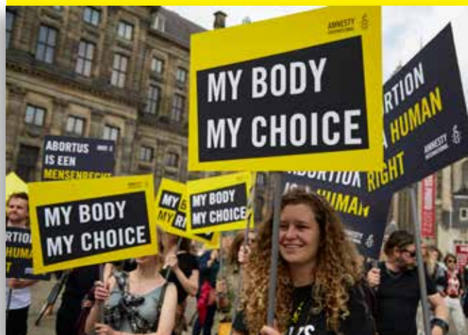
In 2022 protesteerde Amnesty samen met een grote groep Nederlanders voor abortus als mensenrecht.

Tijd over? Bespreek ook de overeenkomsten tussen Nederland en Bangladesh als het gaat om de ligging; beide landen liggen onder de zeespiegel. Nederland werkt hard om deze laaggelegen gebieden te beschermen. Bangladesh heeft daar geen geld voor. Gebruik hiervoor de slide in de Powerpointpresentatie.