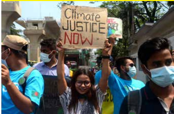
In Bangladesh werd eerder massaal geprotesteerd tegen klimaatverandering.