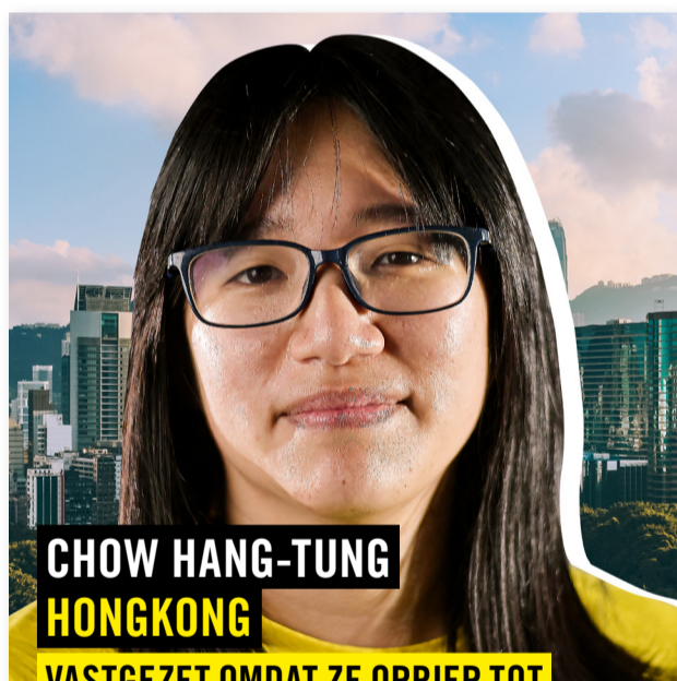
CHOW HANG-TUNG HONGKONG

5 JAAR CEL OMDAT ZE DEMONSTREERDE VANWEGE ZORGEN OM DE ARMOEDE IN HAAR LAND.