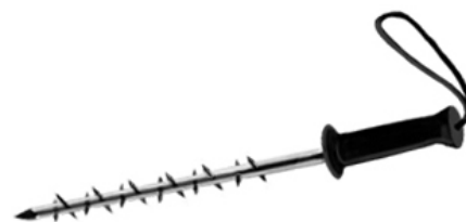
Matraque à pointes

Matraques hérissées de pointes sur toute la longueur. Peuvent être fabriquées en métal ou dans d'autres matériaux. Les matraques sont censées utiliser l'énergie cinétique sans pénétrer la peau. Or, les matraques à pointes sont hérissées de pointes (ou d'autres