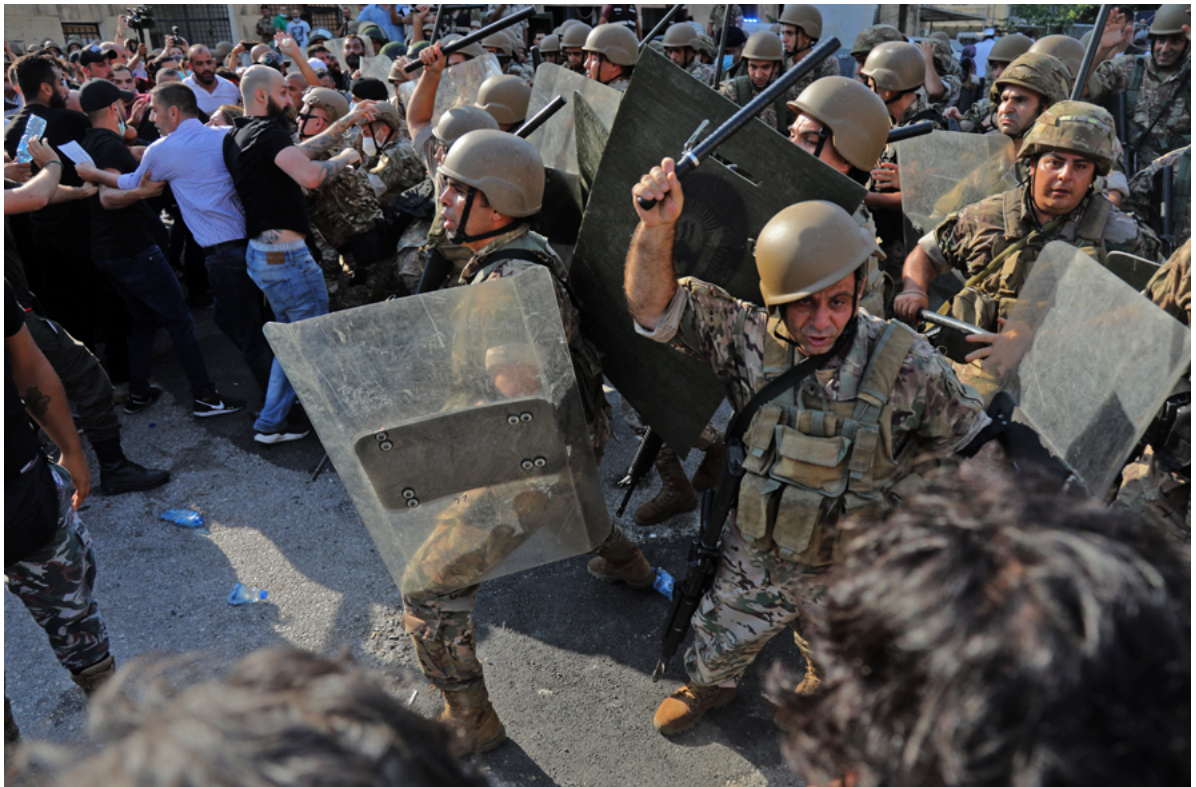
Des agents des forces de sécurité tentant de disperser des personnes qui manifestent devant l'entrée du port de la capitale libanaise le 4 août 2021, à l'occasion du premier anniversaire de l'explosion qui a ravagé le port et la ville.