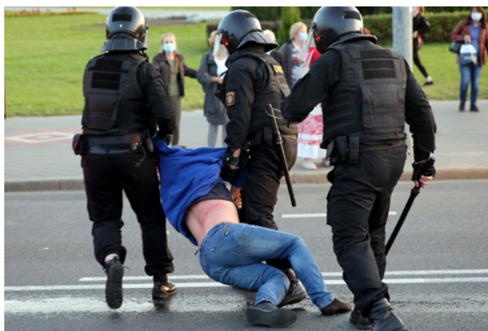
Des policiers antiémeutes emportent un homme avec des traces visibles d'utilisation d'une matraque lors d'un rassemblement de l'opposition contre l'investiture du président à Minsk (Biélorus), le 23 septembre 2020.

Sont généralement considérées comme des zones à faible risque les principales masses musculaires : cuisses et biceps . Dans la plupart des cas, frapper une personne au moyen d'une matraque sur l'une de ces zones provoquera des ecchymoses douloureuses, en fonction du degré de force utilisé ainsi que du matériau et de la forme de l'arme : plus le matériau est mou, moins la blessure sera grave, mais plus l'arme est dure, anguleuse ou tranchante, plus la blessure sera grave.