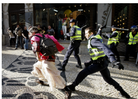
Un policier sur le point de frapper une manifestante par-dessus la tête au Portugal