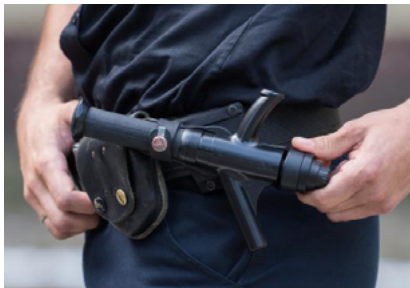
Matraque qui s'allonge automatiquement quand on la sort de son fourreau.