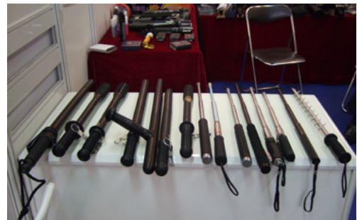
Assortiment de matraques simples, de tonfas et de matraques télescopiques, de fabrication chinoise.

Il faut prêter une attention particulière au matériau et à la conception des matraques. Par exemple, une matraque qui peut facilement se briser comporte des risques considérables pour les responsables de l'application de la loi et la personne contre laquelle elle est utilisée. Les services chargés de l'application de la loi ne doivent pas simplement se fier aux informations fournies par le fabricant, qui peuvent être inexactes ou imprécises, mais procéder à leur propre évaluation – si besoin est, avec l'aide d'expert·e·s scientifiques et médicaux indépendants.