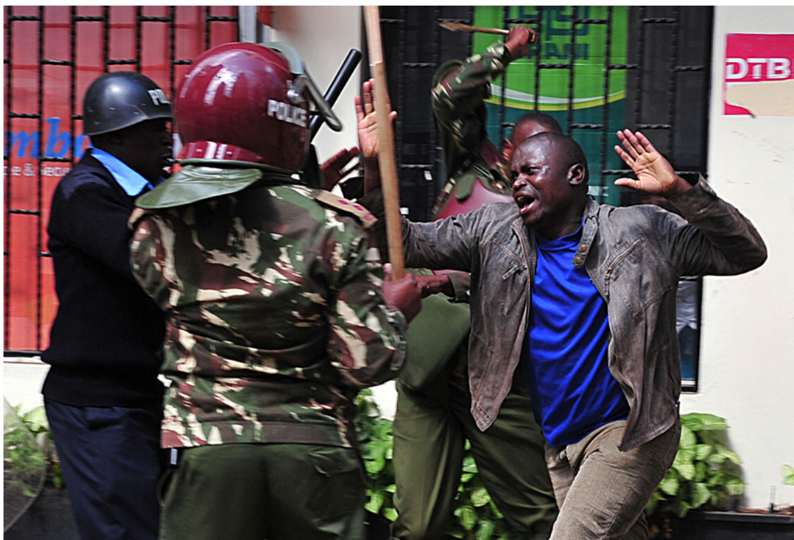
Des agents de la police anti-émeute kenyane menacent de frapper un partisan de l'opposition avec des matraques.