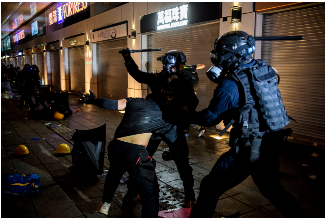
Un homme semble être frappé par-dessus la tête alors que deux policiers sont en train de l'arrêter, à Hong Kong