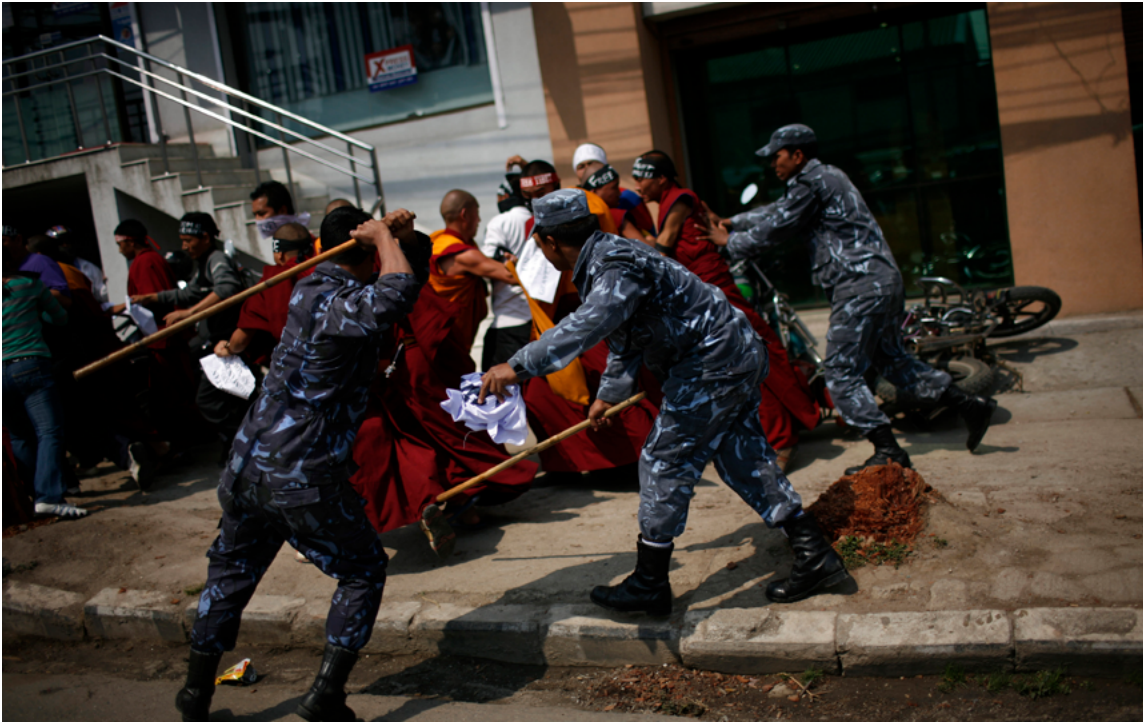
Police au Népal effectuant une « charge à la matraque » avec des baguettes.

Parmi les armes de frappe à main de type cinétique figurent également les baguettes (plus longues), généralement de bambou ou d'autre bois.