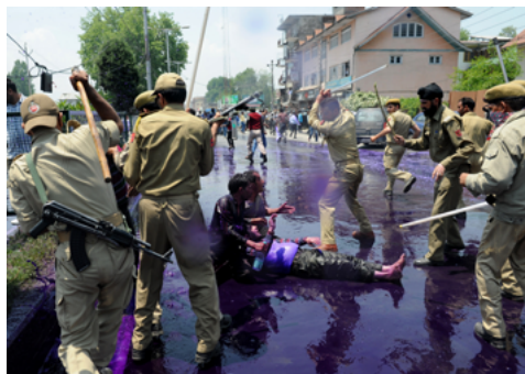
Des policiers indiens menacent d'utiliser leur matraque contre des manifestants à terre à Srinagar.