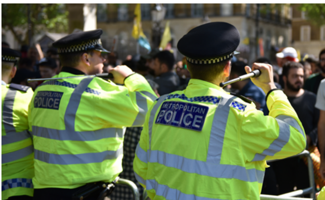
Des policiers tenant leur matraque télescopique au-dessus de leur épaule.

Les responsables de l'application de la loi doivent être correctement et régulièrement formés sur tous les points évoqués ci-dessus et savoir parfaitement se servir de leurs armes 32 . Il faut mettre particulièrement l'accent sur les principes de nécessité (y compris le recours à d'autres solutions moins préjudiciables) et