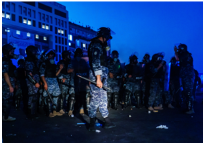
Lebanese Police en tenu anti-émeute équipé de matraque munie d'une poignée.