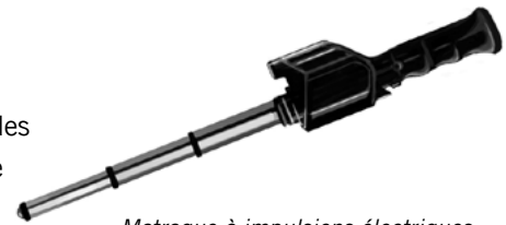
Matraque à impulsions électriques

Armes à main pouvant être utilisées pour administrer une décharge électrique douloureuse en appliquant des électrodes sur la peau du sujet. Généralement dotées de deux à quatre électrodes à leur extrémité, elles comportent parfois des bandes métalliques sur toute leur longueur hors poignée.