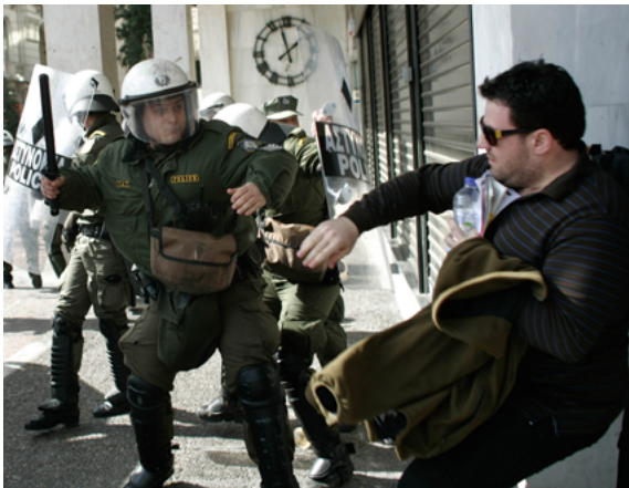
Un policier en tenue antiémeute brandissant sa matraque lors d'une grève générale à Athènes (Grèce).

Comme à chaque fois qu'il est question d'usage de la force, le principe de nécessité exige des responsables de l'application de la loi qu'ils cherchent d'abord à intervenir par des moyens non violents. Ils doivent par conséquent avertir qu'ils recourront à une matraque si l'ordre donné de cesser tout comportement violent n'est pas respecté, en laissant suffisamment de temps à la personne pour obéir à cet ordre. Cette condition est inhérente au principe de nécessité et au devoir des forces de sécurité de causer le moins de préjudice possible. Si une personne cesse toute violence après un avertissement, il n'est plus nécessaire de recourir à une arme 14 . Afin que les dommages soient les plus faibles possible, il convient, avant tout emploi d'une matraque, de permettre à un individu de renoncer à un comportement agressif. Il n'est acceptable de recourir immédiatement à l'arme sans avertissement que si celui-ci mettrait en danger le responsable de l'application de la loi ou autrui, ou bien si cet avertissement serait manifestement sans effet.