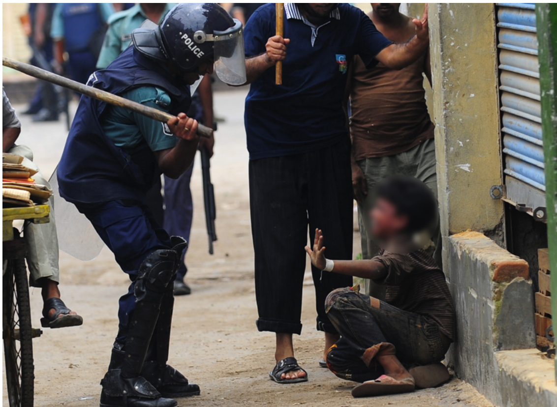
Un policier du Bangladesh sur le point de frapper un enfant avec une matraque.

Les blessures peuvent être plus graves lorsque la personne est d'une corpulence relativement faible : les enfants et les personnes âgées, par exemple, ont moins de masse musculaire donc les coups peuvent plus facilement endommager leurs os. Plus particulièrement, les personnes âgées risquent davantage de subir des fractures.