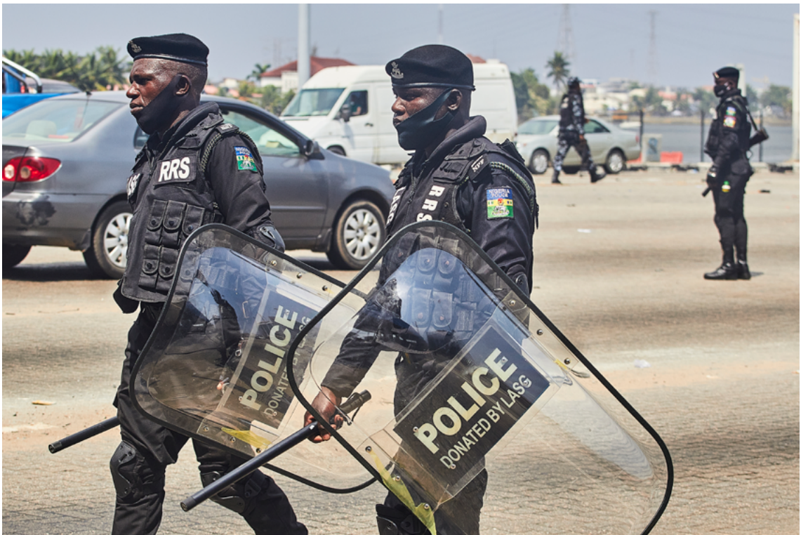
Des policiers en tenue antiémeute lors d'une manifestation à Lagos (Nigeria) en octobre 2020.

Pour veiller à ce que les matraques soient employées dans le respect des droits humains, les autorités doivent communiquer des instructions adéquates et dispenser une formation appropriée à tous les responsables de l'application de la loi qui en sont équipés (voir la section 8). Elles ont également des obligations importantes en ce qui concerne la mise au point et l'expérimentation de ces armes, ainsi que leur vente et leur transfert aux forces de sécurité d'autres pays (section 9).