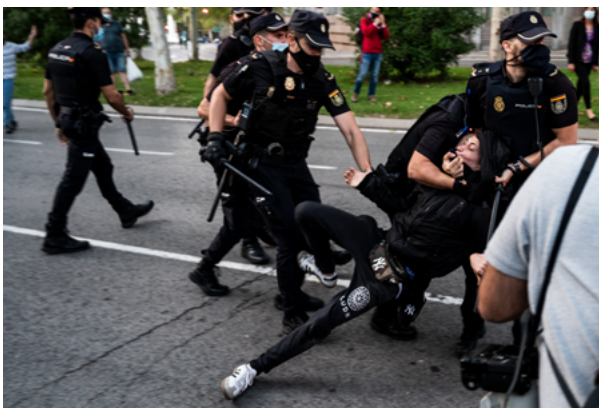
La police de Madrid (Espagne) arrête un manifestant, qui proteste contre les nouvelles mesures visant à stopper la propagation du coronavirus, septembre 2020.

La pandémie de COVID-19 a créé des difficultés nouvelles et non négligeables dans le domaine de l'application de la loi. Le rôle des agents est devenu particulièrement important, difficile et sensible. Par ailleurs, les missions de ceux-ci qui consistent à maintenir l'ordre public, prévenir et décourager la délinquance et aider les personnes dans le besoin sont toujours aussi pertinentes. Malheureusement, depuis le début de la pandémie, Amnesty International a recueilli des informations sur un recours abusif et généralisé à la force 11 , notamment en ce qui concerne les matraques 12 .