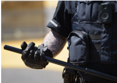
Matraque simple.