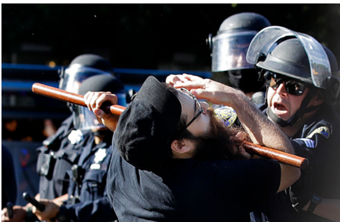
Un policier appuie une matraque contre la gorge d'un manifestant à San Jose (Californie), mai 2020.

Ce risque est encore plus élevé si l'arme n'est pas utilisée pour frapper une personne mais pour la maîtriser au moyen d'une position d'étranglement. Il s'agit clairement d'une mise en danger de la vie.