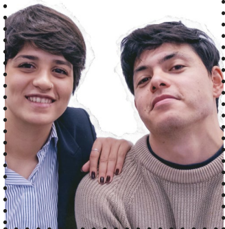
SARAH MARDINI EN SEÁN BINDER (GRIEKENLAND)