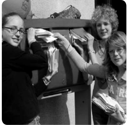
Leerlingen van het Laurenscollege versturen brieven

Kijk op www.youngamnesty.nl wat jij kunt doen.