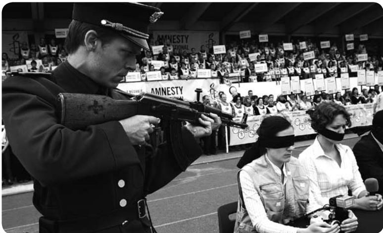
Franse Amnesty-actie voor persvrijheid

zorgen omdat het sluiten van websites en internetcafés om politieke redenen, en het bedreigen en opsluiten van website beheerders, steeds vaker voorkomt.