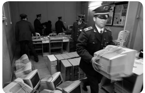
De politie in China neemt computers in beslag in een illegaal internetcafé

Maar jammer genoeg wordt ook op internet de vrijheid van meningsuiting beperkt. In landen als Vietnam, Iran, Syrië en Tunesië, China en Myanmar wordt het internet door de overheid streng gecensureerd. Dit betekent dat de overheid voor een groot deel bepaalt welke informatie mensen wel en niet mogen opzoeken, welke website ze wel en niet mogen bekijken. Sommige websites worden gewoon geblokkeerd. Zo kun je in Syrië geen Israëlische websites bekijken. En in Oezbekistan en