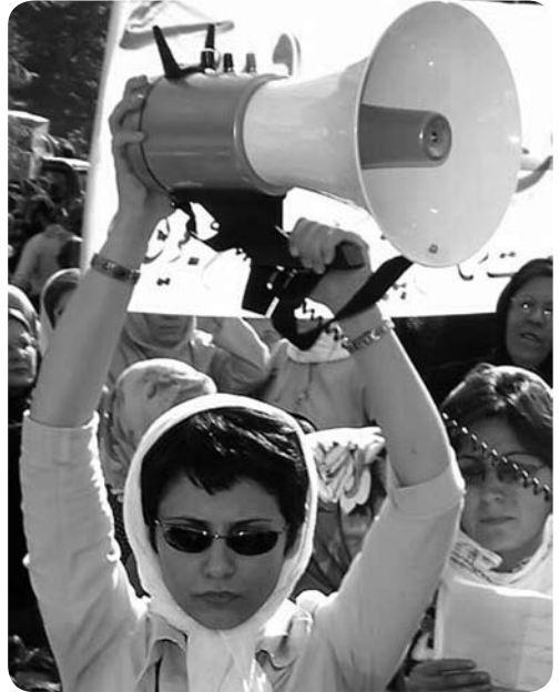
Vrouwen demonstreren voor gelijke rechten in Iran

Dat je vrij bent om te denken en te zeggen wat je wilt, staat bijvoorbeeld in de Nederlandse Grondwet en in internationale verdragen. Het staat ook in de Universele Verklaring van de Rechten van de Mens (UVRM). Wat hierin staat, geldt voor iedereen, waar ook ter wereld. Eigenlijk zou dus iedereen vrij moeten zijn om te denken en zeggen wat hij of zij wil.