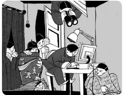
Internetcensuur in China

Amnesty vindt dat Yahoo op deze manier meewerkt aan de schending van vrijheid van meningsuiting. Yahoo is trouwens niet het enige internetbedrijf dat informatie doorgeeft. Ook Microsoft gaf bijvoorbeeld in 2004 informatie over Mordechai Vanunu, die van de regering van Israël geen contact mocht hebben met buitenlandse media (ook dat verbod is een mensenrechtenschending!) door aan de Israëlische autoriteiten.