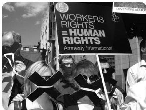
Amnesty protesteert in Londen voor de vrijlating van twee Zimbabwaanse vakbondsleden die vastzitten omdat ze zich uitspraken tegen geweld van de overheid

In Nederland zijn we gewend te kunnen zeggen en schrijven wat we willen. Daarbij hebben we met elkaar afgesproken dat we de rechten van andere mensen blijven beschermen. 'Haatzaaien' mag dus niet en je mag ook niet discrimineren. Maar in principe mag iedereen op straat, in de klas, in de krant of op het internet zijn of haar eigen mening geven.