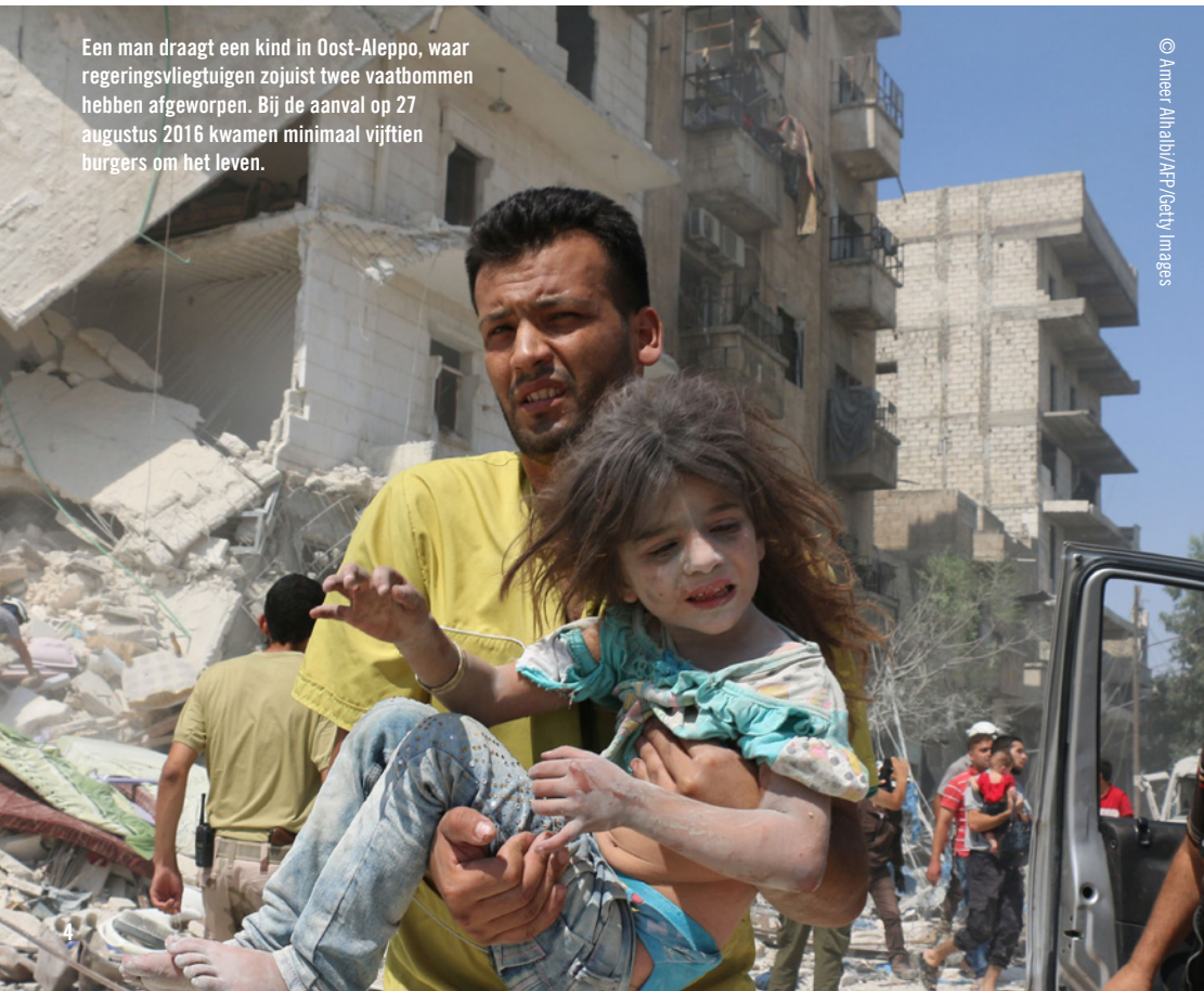
Een man draagt een kind in Oost-Aleppo, waar regeringsvliegtuigen zojuist twee vaatbommen hebben afgeworpen. Bij de aanval op 27 augustus 2016 kwamen minimaal vijftien burgers om het leven.

Maar er zijn ook mensen die hun land om economische (armoede, werkloosheid) of ecologische redenen (natuurrampen) verlaten. Zij zijn volgens het VN-Vluchtelingenverdrag geen vluchteling. Andere landen zijn daarom niet verplicht hen te beschermen.