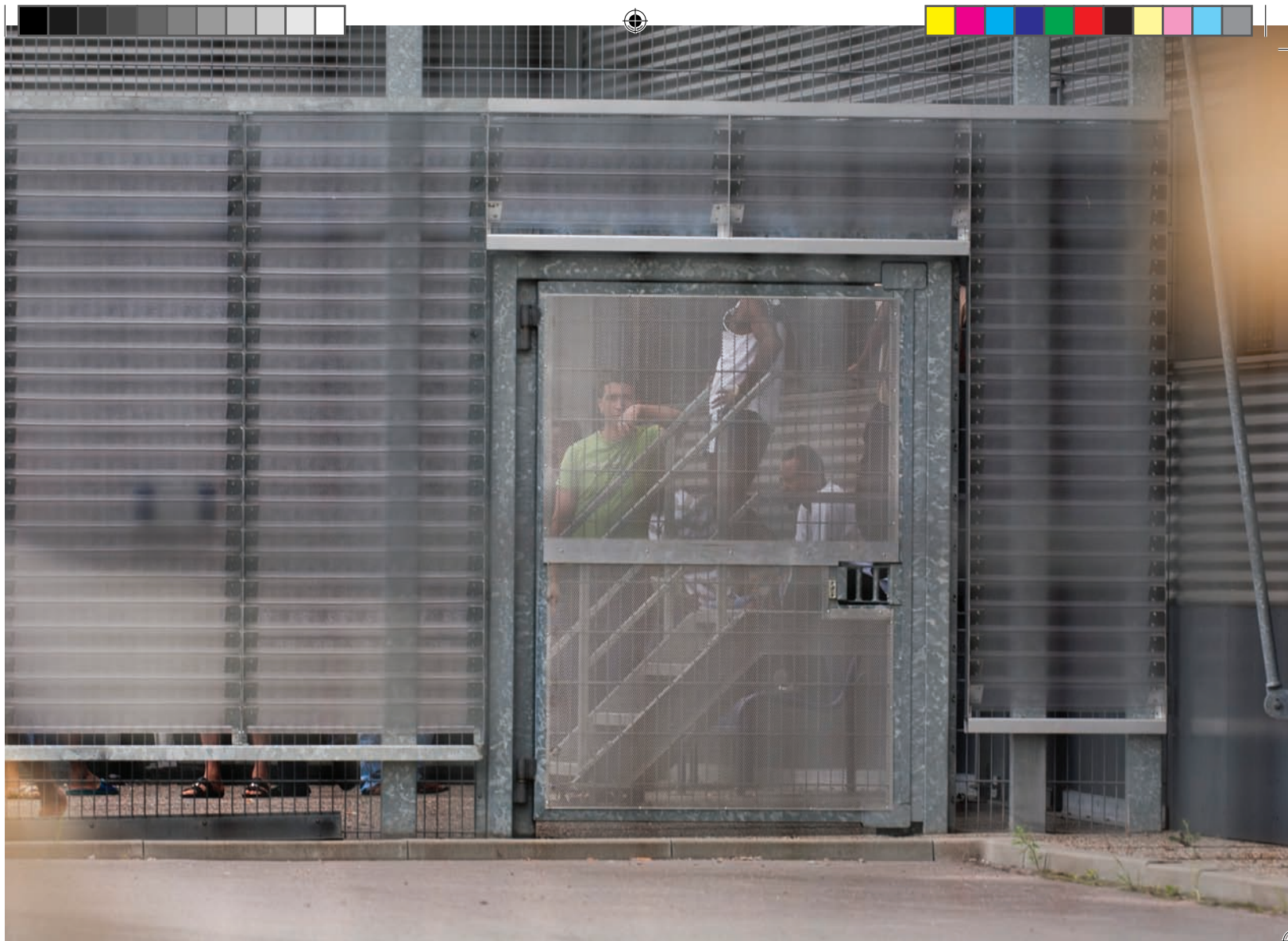
Gedetineerden in een luchtkooi in detentiecentrum Schiphol-Oost.

leidt tot verslechtering van de psychische of lichamelijke gesteldheid van een gedetineerde. Amnesty International vindt dit een te beperkte uitleg van het begrip 'detentieongeschiktheid'. De schade die iemand op kan lopen door zijn verblijf in detentie moet ook worden meegenomen bij de beoordeling. Hierin heeft ook het medisch personeel een belangrijke rol. Amnesty pleit voor een regeling zoals 'Rule 35' in het Verenigd Koninkrijk, op grond waarvan medici moeten melden wanneer continuering van de detentie of een bepaalde detentieomstandigheid een nadelig effect zal hebben op de gezondheid van de gedetineerde vreemdeling. 83