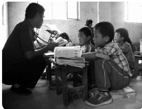
Chinese jongetjes in een geïmproviseerd klaslokaal

Dat komt bijvoorbeeld veel voor in China. In verschillende steden en provincies daar mogen ouders maar één kind hebben. Veel ouders hebben liever een zoon, daarom plegen ze abortus als ze weten dat ze een meisje gaan krijgen, of doden ze de baby. Andere Chinese ouders geven de geboorte van het meisje gewoon niet aan bij de overheid, in de hoop nog een jongetje te krijgen. Het gevolg is dat miljoenen meisjes in China geen identiteitspapieren hebben, en daardoor ook geen rechten. Ze komen van het ene probleem in het andere.