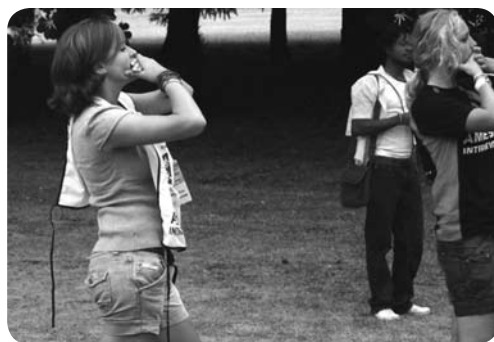
Actie voor vrijheid van meningsuiting op Amnesty-jongerenkamp in Frankrijk, 2008

Het Verdrag voor de Rechten van het Kind bestaat uit 54 artikelen. Artikel één tot en met veertig gaan over de rechten van het kind. De andere artikelen, 41 tot en met 54, gaan over het verdrag zelf. In de bijlage (hoofdstuk 6) staan alle de kinderrechten op een rijtje.