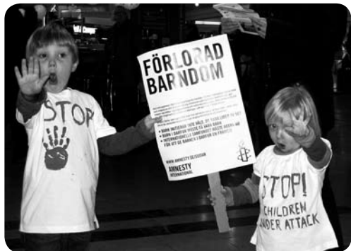
Zwitserse kinderen demonstreren voor de bescherming van de kinderen in Darfur

De afspraken die in het Verdrag voor de Rechten van het Kind staan, hebben veel landen in hun wetten opgenomen. Aan die wetten moeten regeringen zich houden. Amnesty doet onderzoek om uit te vinden of zij dat ook echt doen. Jammer genoeg ontdekken de onderzoekers vaak dat de werkelijkheid nog erger is dan je zelf zou bedenken.