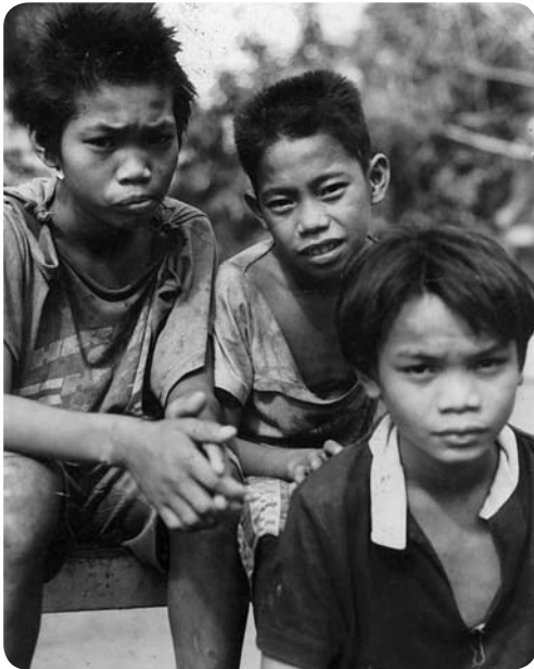
Straatkinderen in de Filipijnen

Het Verdrag voor de Rechten van het Kind bestaat dus al sinds 1989. In 2007 is het verdrag achttien jaar geworden. Volwassen dus! Toch is er in de wereld nog veel mis. Lang niet alle kinderen gaan naar school. Veel kinderen moeten werken om te kunnen leven. Er zijn nog steeds kinderen die niet genoeg te eten hebben. Er zijn zelfs kinderen die meevechten in oorlogen.