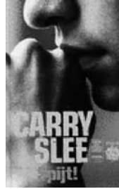
Spijt - Carry Slee, Lucifer Prometheus, 1995

Op school is Judith stil en teruggetrokken. Thuis probeert ze het haar moeder zoveel mogelijk naar de zin te maken en te helpen met de verzorging van haar kleine broertje, maar toch wordt haar moeder vaak boos. Dan slaat ze Judith, soms zo erg dat ze onder de blauwe plekken zit. Op school durft Judith niets te vertellen en niemand merkt wat er aan de hand is.