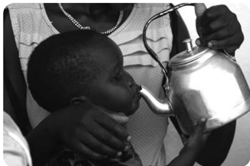
Zuid-Soedanezen in Ethiopië

Met voorzieningen bedoelen we onderwijs (bijvoorbeeld scholen en materialen), gezondheidszorg (doktoren, ziekenhuizen, medicijnen), voldoende eten en drinken en een veilige plek om te leven en te spelen (bijvoorbeeld een huis).