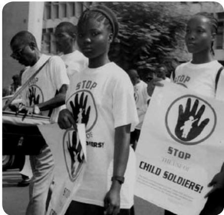
Honderden schoolkinderen demonstreren tegen het gebruik van kindsoldaten in Freetown, Sierra Leone, 22 maart 2002

In Sierra Leone woedde van 1991 tot 2002 een burgeroorlog waarbij veel kinderen als soldaat werden ingezet. Zij werden gedwongen mensen te doden of te verwonden, vaak onder invloed van drugs of alcohol, of uit angst. Komba was één van deze kindsoldaten. Hij werd in 1997 ontvoerd door de rebellen die tegen de regering vochten. Komba vertelde Amnesty in 2000 dat hij had gevochten toen de rebellentroepen in januari 1999 de stad Freetown aanvielen. De rebellen hadden hem cocaïne gegeven, zodat hij zich een 'grote jongen' voelde, niet meer bang was en graag mensen wilde vermoorden.