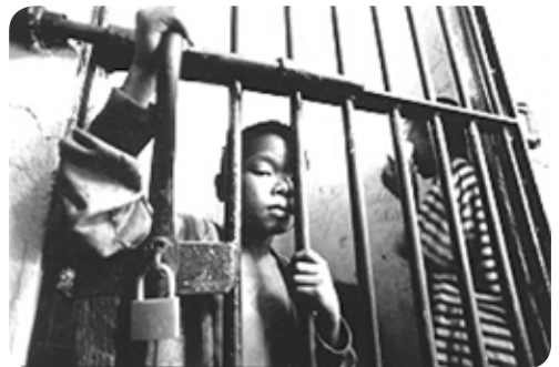
Kind in een Filipijnse gevangenis

zijn kinderen met een handicap er vaak slecht aan toe. Op vakantie in Zuid-Afrika zag ik een kind dat heel moeilijk liep. Wat zou hij blij zijn met een rolstoel! Gehandicapte kinderen moeten net zo goed de mogelijkheid krijgen om zich te ontwikkelen. Volgens de kinderrechten hoort dat ook zo, maar in veel landen worden gehandicapten helaas vaak als last gezien.'