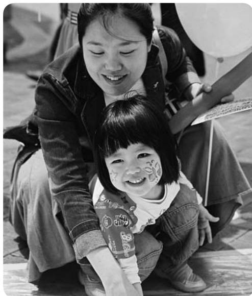
Zuid-Korea Kinderdag 2007

'Ik vind het belangrijk dat er speciale rechten voor kinderen zijn. Voor 1874 toen meneer Van Houten de kinderwet in Nederland invoerde, was er veel kinderarbeid. Nu niet meer, behalve nog steeds in armere landen. Maar wel minder dan vroeger. Ik vind recht op