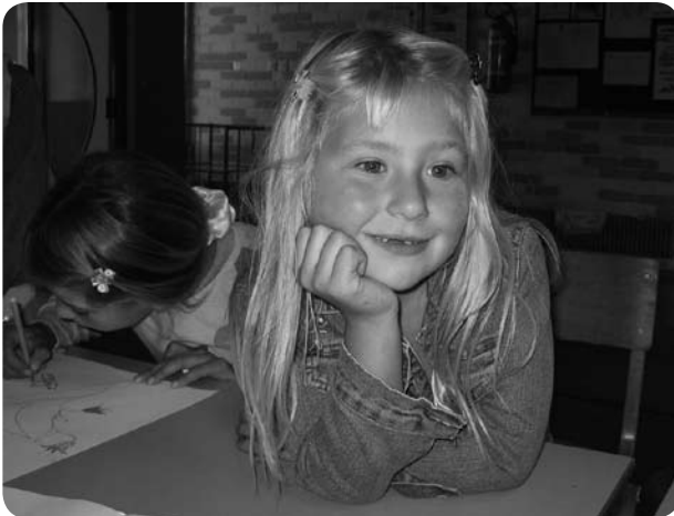
Roma-meisje op school in Slovenië

Nederlandse scholieren verzamelden in 2006 ruim 90.000 handtekeningen voor beter onderwijs voor Roma-kinderen in Slovenië. Vier leerlingen van het Christelijk Lyceum Delft boden deze samen met Amnesty aan bij de Sloveense ambassade.