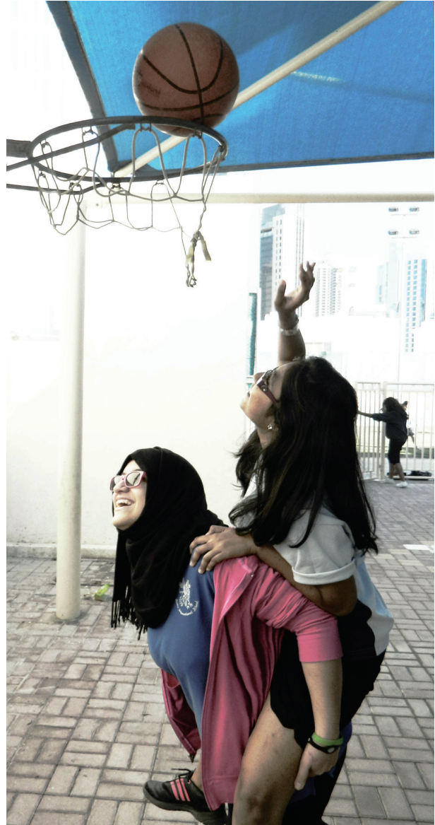
Meisjes spelen basketbal tijdens een internationaal festival in Qatar.

Amnesty International roept Europese instellingen en regeringen op om discriminatie van moslims dringend aan te pakken door effectieve wetgeving, beleid en andere maatregelen te ontwikkelen en door te voeren.