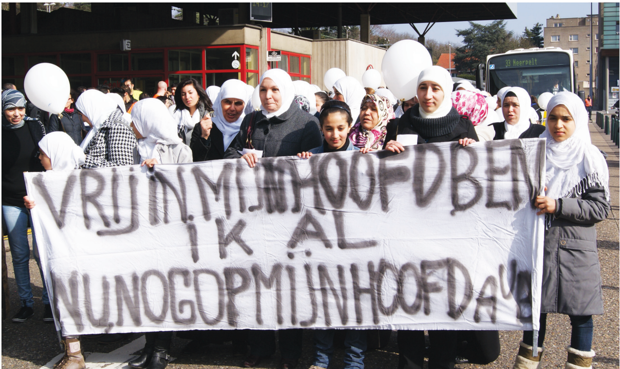
Demonstratie in Genk (België), maart 2011. Zo'n driehonderd Vlaamse moslima's protesteerden tegen het ontslag van een HEMA-medewerkster vanwege haar hoofdoek.

Een verbod op het dragen van religieuze en culturele symbolen en kleding is geen discriminatie als er een objectieve en redelijke rechtvaardiging voor is, bijvoorbeeld als de volksgezondheid of de veiligheid in het geding is. Het verbod moet daarnaast ook in verhouding staan tot het beoogde doel. Ter illustratie kan een oordeel dienen van het VN-Comité voor de Rechten van de Mens. Naar aanleiding van de klacht dat de veiligheidsvoorschriften om een helm te dragen een indirecte discriminatie zou betekenen voor sikhs, die volgens hun religieuze traditie een tulband moeten dragen, oordeelde het Comité dat de veiligheid van de werknemers objectief gerechtvaardigd was, en het voorschrift dus passend, en geen schending van het principe van non-discriminatie.