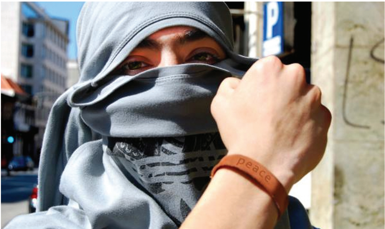
Foto gemaakt in het kader van Amnesty's fotocampagne tegen discriminatie in Europa. Wetgeving in België verbiedt het bedekken van het gezicht in het openbaar.

Een van de argumenten voor een algeheel 'boerkaverbod' is de noodzaak om gendergelijkheid te garanderen en vrouwen te beschermen tegen het onder druk of dwang dragen van een gezichtssluier.