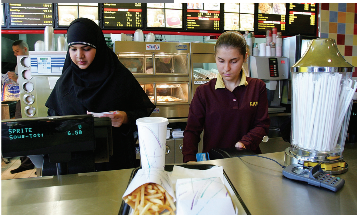
Medewerkers van BKM (Beurger King Muslim) in Clichy-sous-Bois, Parijs.

Moslims met een migratie-achtergrond zijn etnisch gezien heel divers. Zo komen de grootste groepen moslims in Frankrijk oorspronkelijk uit Algerije, Marokko, Tunesië en de Afrikaanse landen ten zuiden van de Sahara, terwijl het in België en Nederland