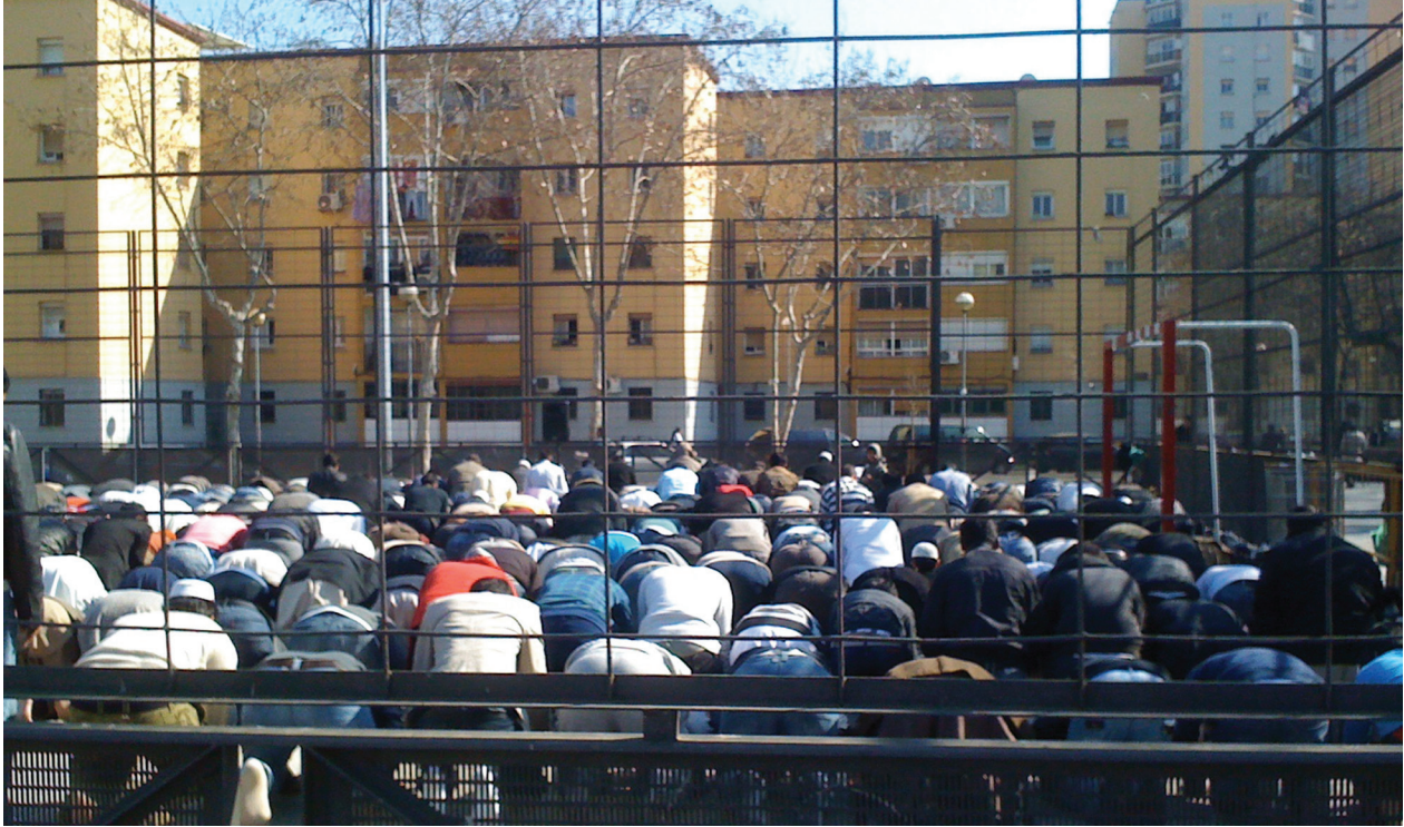
Muslims bidden buiten in Badalona, Catalonië (Spanje). Muslims bidden vaak buiten, omdat de bestaande gebedsruimten te klein zijn.