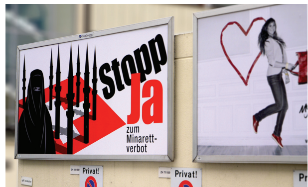
Een campagneposter van de Zwitserse Volkspartij. De campagne resulteerde in 2009 in een verbod op het bouwen van nieuwe minaretten op moskeeën. In het hele land hebben slechts vier moskeeën een minaret.

In steden als Barcelona, Badalona, Lleida en elders in Catalonië moeten moslims buiten bidden, omdat de bestaande gebedsruimten te klein zijn. Een aantal politieke partijen heeft het verzoek van moslimorganisaties om een nieuwe moskee te openen afgeschilderd als niet verenigbaar met respect voor de Catalaanse tradities en cultuur.