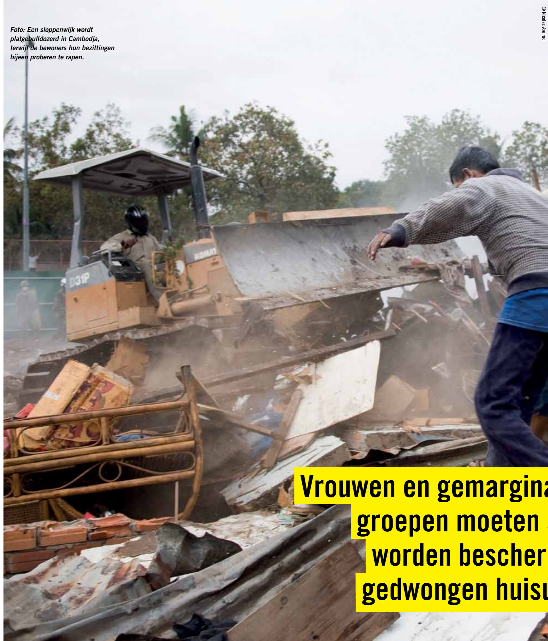
Foto: Een sloppenwijk wordt platgebulldoerd in Cambodja, terwijl de bewoners hun bezittingen bijeen proberen te rapen.