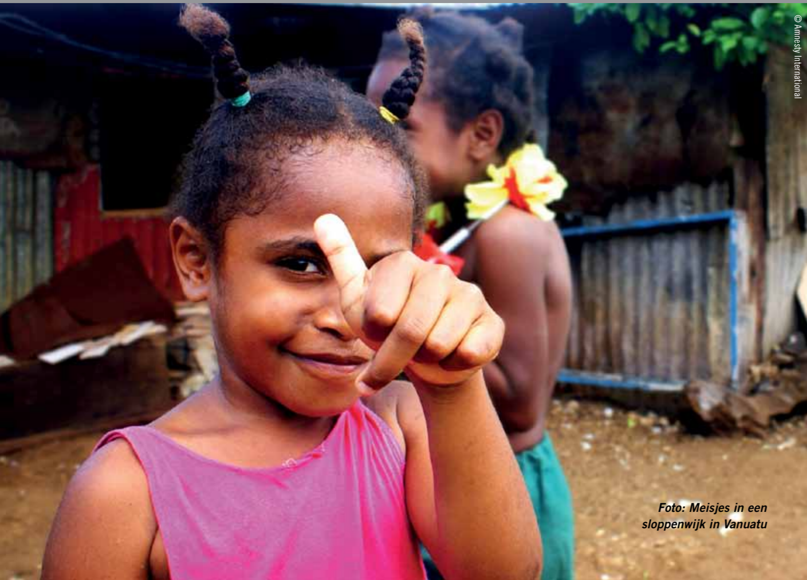
Foto: Meisjes in een sloppenwijk in Vanuatu

VN-Commissie voor de Rechten van de Mens, 1993