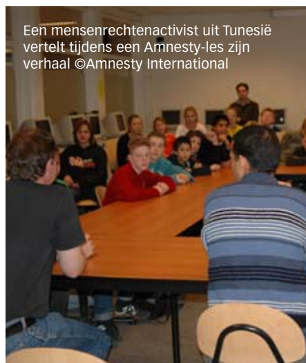
Een mensenrechtenactivist uit Tunesië vertelt tijdens een Amnesty-les zijn verhaal